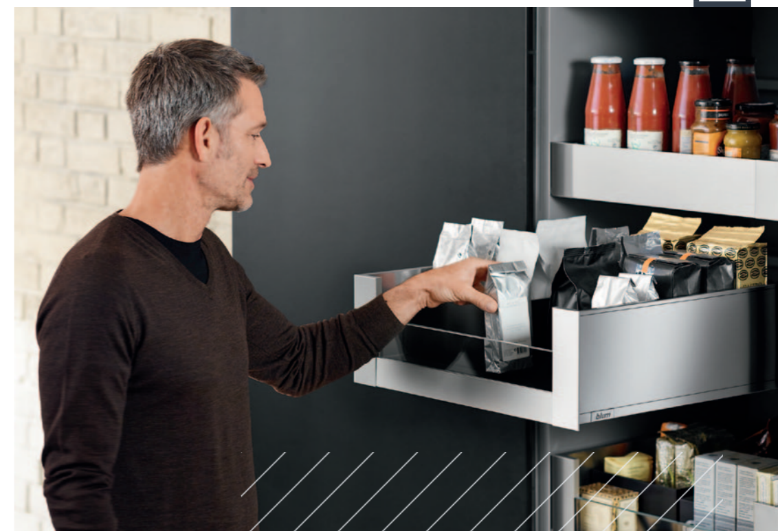
Шкаф для запасов с ящиками LEGRABOX