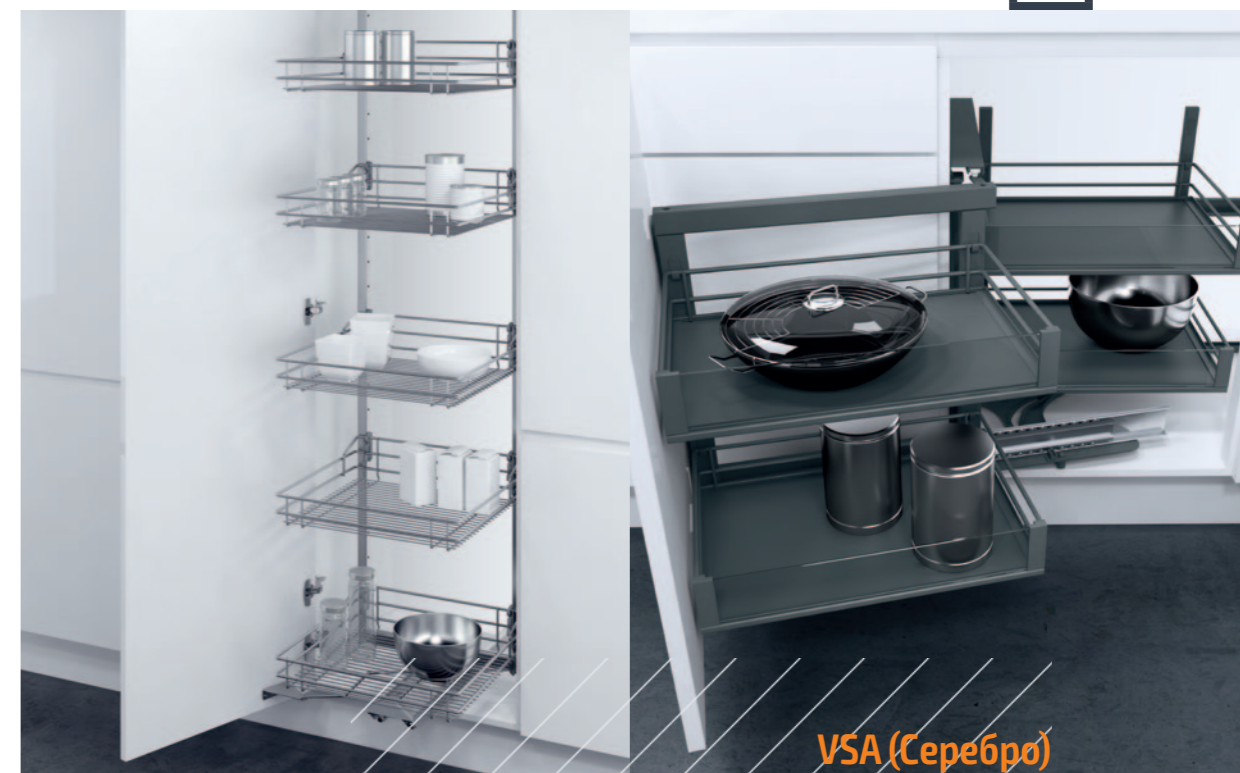
VSA (Серебро) Wari Corner (Lava Gray)