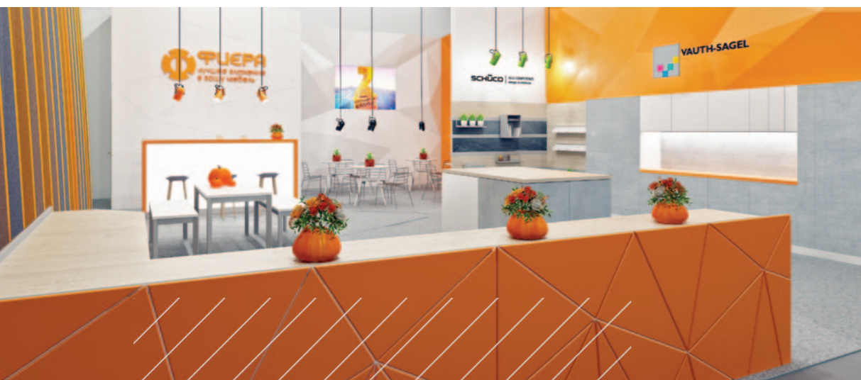
Наш уютный стенд

Уже в 28-й раз в Москве прошла крупнейшая отраслевая выставка «Мебель-2016», которая ежегодно становится главным событием мебельного рынка в России и Восточной Европе. Каждую осень в «Экспоцентре» собираются ведущие мировые бренды