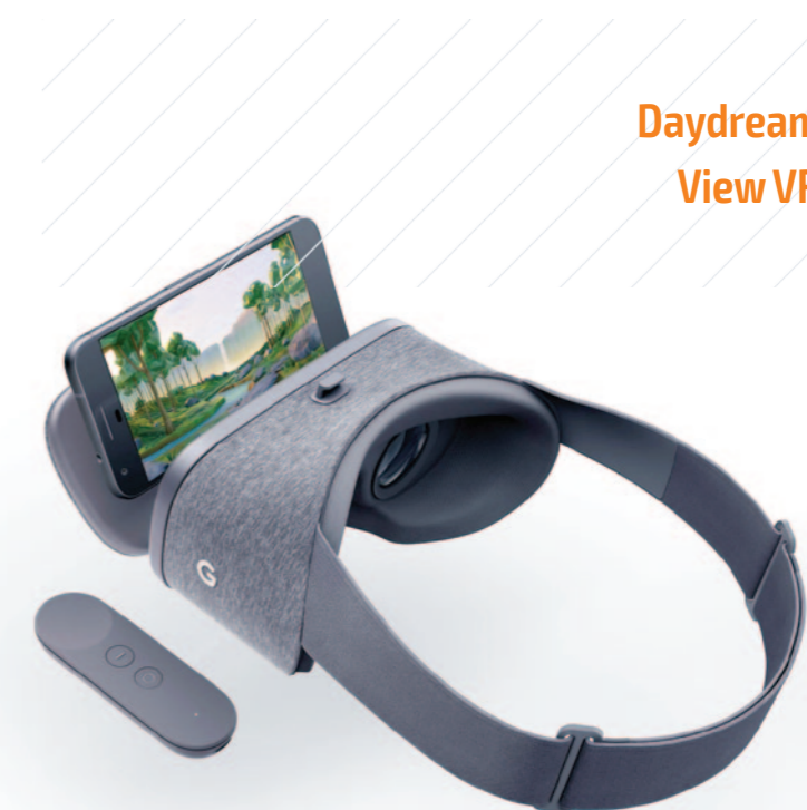
Daydream View VR